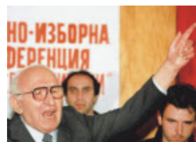
Ex-Diktator Todor Schiwkow 1998 vor Bulgariens Sozialisten

So ist etwa der amtierende Premier Bojko Borissov nicht nur ein ehemaliger Student der Stasi-Hochschule, sondern er ist heute noch stolz darauf, der Chef-Leibwächter von Todor Schiwkow gewesen zu sein.